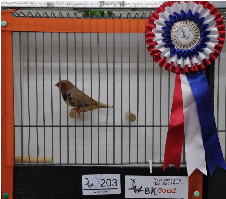
De winnende Zebravink (zwartborst bruin man) van Oege Rinzema