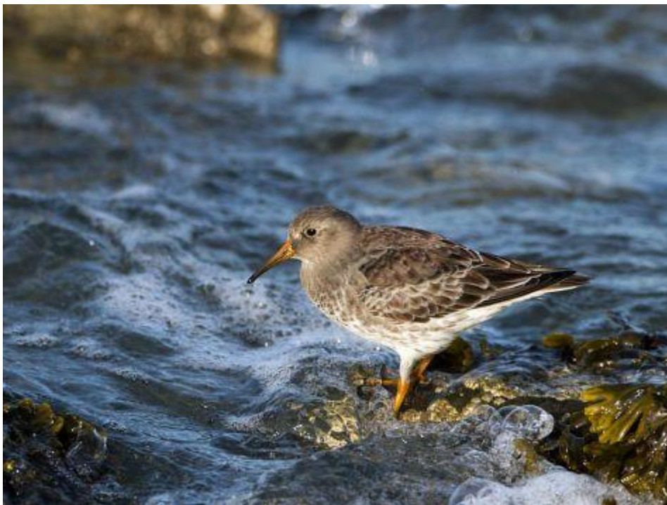
Paarse strandloper in zijn element

Voor veel mensen zijn al die obscure strandlopertjes maar moeilijk uit elkaar te houden. De paarse strandloper is echter heel gemakkelijk te herkennen. Hij heeft een uniek, donker paarsbruin verenkleed en ook nog mooie gele poten en een gele snavelbasis. Bovendien zit de paarse strandloper niet op wad en slik, maar is hij uitsluitend te vinden op pieren, dammen en dijken aan zee. Daar waar het zeewater over de basaltblokken spat en de vogels af en toe even moeten opvliegen om niet drijfmat te worden, daar zoekt Calidris maritima zijn voedsel: schelpdieren, slakjes, kreeftachtigen, wormpjes, insecten, etc. Paarse strandlopers zijn tam en zijn daarom prachtig te zien als ze aan het foerageren zijn. Vaak zijn ze in gezelschap van steenlopers en net als deze kiepen ze ook zeewier om, om te zien of er daaronder nog iets eetbaars is te vinden.