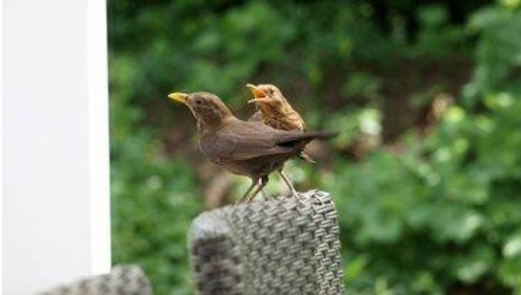
Merel met jong