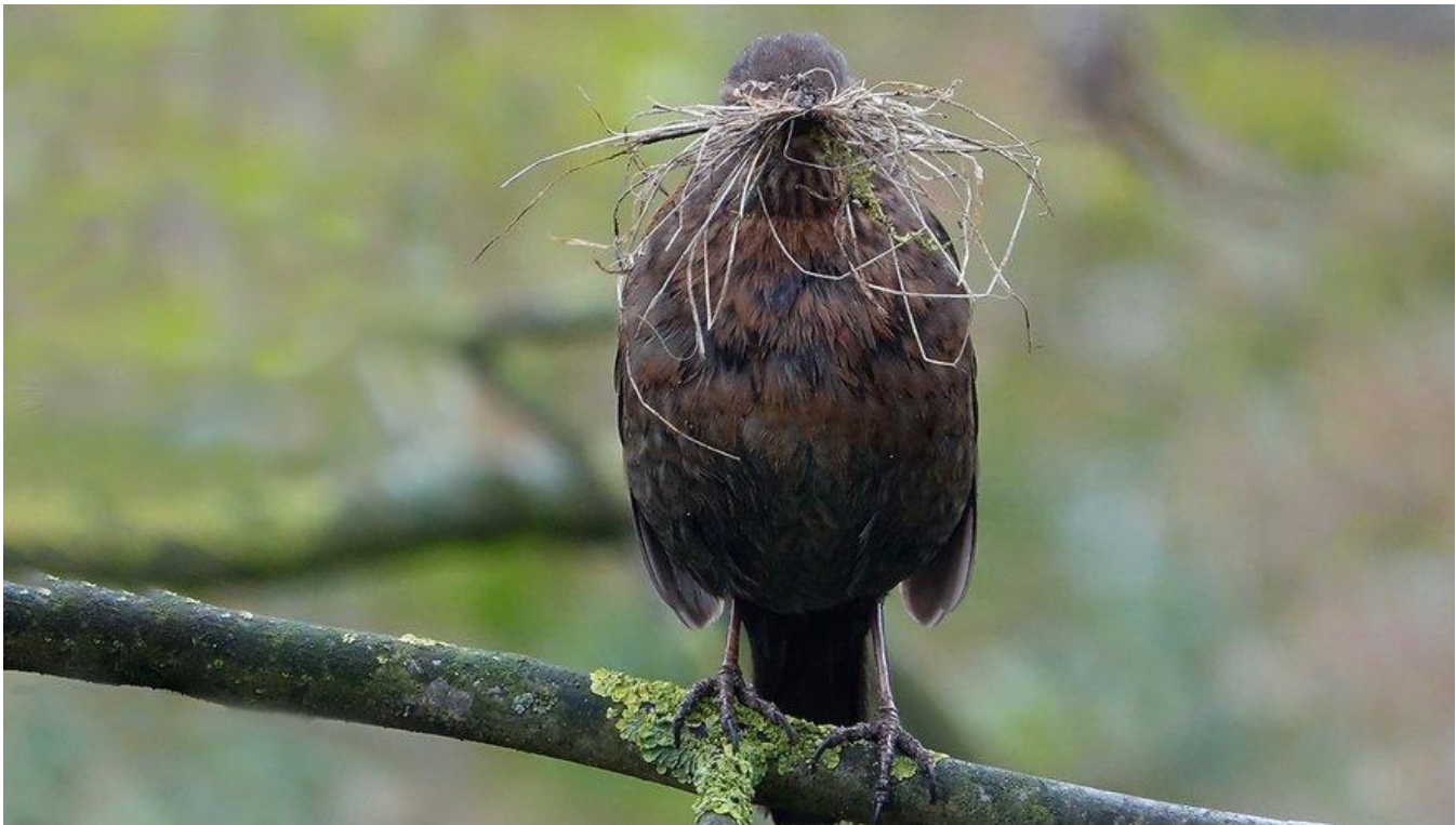
Merel met nestmateriaal

Allereerst maar eens het verschil tussen de verschillende soorten vogels. Vogels die lang voor hun jongen zorgen – met name de grote soorten als ooievaars, meeuwen, roofvogels en uilen – houden het altijd na één nest voor gezien. Er is simpelweg geen tijd meer voor een tweede. Anders ligt dat bij het overgrote deel van de zangvogels. Broed- en voedtijd zijn relatief kort. Zo vliegen de jongen van een fitis al twee weken nadat ze uit het ei gekropen zijn uit (en worden dan nog wel ongeveer een week een beetje bijgevoerd) en verlaten koolmeesjongen na drie weken het nest.