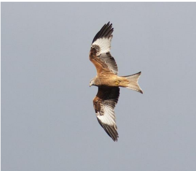
Rode wouw

De ooievaar was in de jaren zeventig bijna verdwenen uit ons land. Dat zou je niet zeggen als je nu buiten loopt. In bijna het hele land zijn ooievaars te zien. Ze zijn massaal teruggekomen en hun broedseizoen is begonnen. Je kunt hun prachtige grote, zwartwitte gestalten over je heen zien vliegen op het platteland, terwijl ze op zoek zijn naar een lekker hapje eten. Kijk ook binnen de bebouwde kom eens omhoog: ooievaars broeden graag op hoge gebouwen, zoals telefoonpalen of schoorstenen. Ook de bekende door mensen gebouwde ooievaarsnesten bezoeken ooievaars graag. Rond deze tijd vindt de balts plaats. Luid klepperend gooien ooievaars hun kop in de nek om indruk op elkaar te maken. In april zullen ze hun enige nest van dit jaar krijgen.