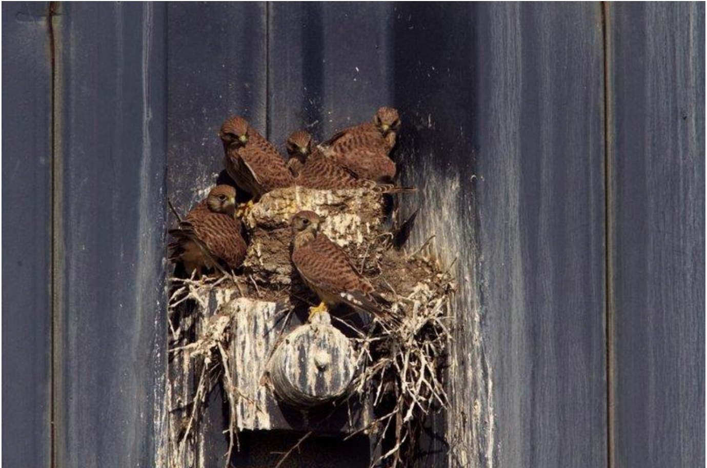
Jonge torenvalken op het nest

Ook de eerste jonge torenvalken zijn nu vliegvlug en klaar om het nest te verlaten. Torenvalken broeden een keer per jaar, het vrouwtje legt vier tot zes eieren. Dat doen ze niet allemaal tegelijk: sommige paartjes zijn al in april begonnen met broeden, bij andere zijn de eieren net pas uitgekomen. Ze zitten ongeveer een maand op de eieren, en het duurt dan nog een maand voor de jongen kunnen vliegen. Dan zijn ze nog niet zelfstandig: ze worden meestal nog wekenlang gevoerd door de ouders. Jonge torenvalken lijken op de vrouwtjes, bruin met zwart gestreept. De jonge mannen krijgen pas later de grijze kop en staart. De torenvalk is een van de meest algemene roofvogels in Nederland. Je ziet er vaak eentje ‘biddend’ in de lucht hangen, wachtend tot hij een muis ziet. Let volgende keer eens op of je kan zien of het een mannetje of vrouwtje is.