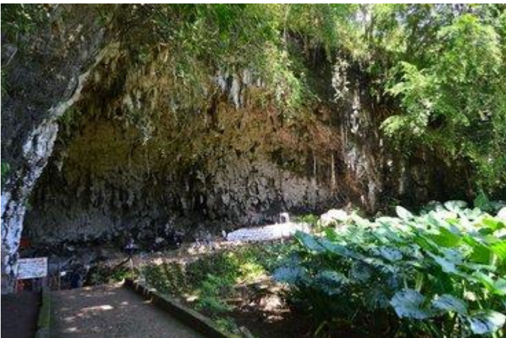
De Liang Bua grot op het eiland Flores

De uitgestorven Flores reuzenmaraboe ( Leptoptilus robustus ) is ontdekt in 2010. Men dacht dat deze vleesetende vogel niet kon vliegen. Maar nu, twaalf jaar later, is daar verandering in gekomen door de vondst van meerdere reuzenmaraboebotten in de grot van Liang Bua. De kalksteengrot ligt op het Indonesische eiland Flores, waar ook de eerste botten van de Floresmens zijn ontdekt. De onderzoekers hebben dankzij de ontdekking van de extra maraboebotten nu een beter beeld over het leven van deze enorme aaseter.