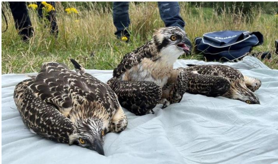
Drie levendige, jonge visarenden tijdens het ringen

Visarenden broeden pas sinds 2016 in ons land. Om meer kennis over ze te verzamelen worden er indien mogelijk jonge vogels geringd. Met behulp van kleurringen is beter te bepalen welke gebieden ze bezoeken, hoelang ze blijven leven en of ze in de toekomst terugkeren naar ons land. Zulke gegevens dragen uiteindelijk bij aan een betere bescherming van de soort. Visarenden zijn echte trekvogels, die vooral langs de kust van West-Afrika overwinteren. In de Biesbosch broeden visarenden in bomen en in hoogspanningsmasten van TenneT. Alleen het nest in een hoogspanningsmast kan veilig bereikt worden om de jongen te kunnen ringen. Het ringen moet zowel zorgvuldig als snel gebeuren om de visarenden zo min mogelijk te verstoren.