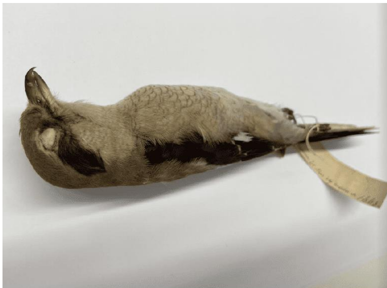
De herontdekte Siberische Noordelijke Klapekster in de collectie van Naturalis