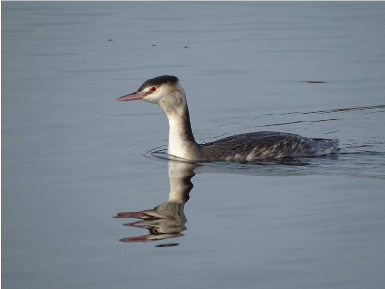
Fuut in winterkleed

het water. Roodkeelduikers zijn viseters, en waar ze zich ophouden hangt af van het voedselaanbod. De rode keel hebben ze in nu niet, hun winterpak is grijs-met-wit. In het voorjaar krijgen ze hun rode keel weer terug. Dan trekken ze naar Scandinavië, waar ze in het binnenland broeden aan meren en plasjes.