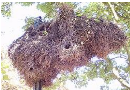
Nest van monniksparkieten in Brussel

Deze kolonievogels nestelen in vrij grote groepen. Ze bouwen zeer grote vrijstaande nesten, die een diameter hebben van wel een meter. De binnenzijde van de nesten zijn bedekt met zachte grasstengels, het overige bouwwerk wordt gemaakt van takken. In een boom bevinden zich vaak meerdere nesten en elk nest wordt vaak door meerdere paartjes bewoond. Elk paartje heeft in zo'n nest zijn eigen kraamkamer. Ook buiten de broedtijd worden de nesten door de vogels bewoond.