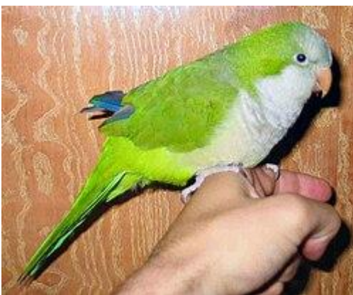
Monniksparkiet ( Myiopsitta monachus )

De ondersoort M. m. luchi uit Midden-Bolivia heeft volgens BirdLife International en de IOC World Bird List de status van aparte soort, de klifparkiet .